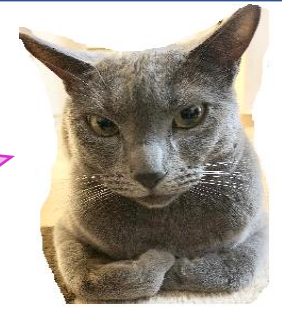
《ひこまる》 ロシアンブルーの8歳