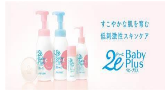
すこやかな肌を育む 低刺激性スキンケア

ドゥーエは敏感肌の方でも使用可能な、低刺激スキンケアブランドです。アトピー性皮膚炎や接触皮膚炎などの疾患肌や、赤ちゃんの肌にも使用可能なスキンケア商品です。当薬局では、ドゥーエ商品を数多く取り揃えております。是非お試しください！